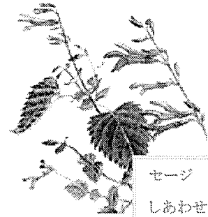
セージ 花言葉 しあわせな生活