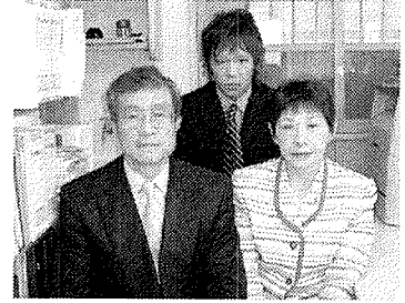
私たち、頑張ってます！