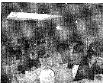
メモを一生懸命に とっている皆さん

今月は2月16日に「適確退職年金の廃止と退職金制度の行方」というテーマで行います。楽しみにしててください。