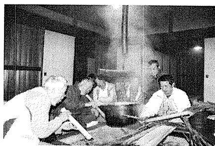
なかなか難しいなあ～（ゲホゲホ）