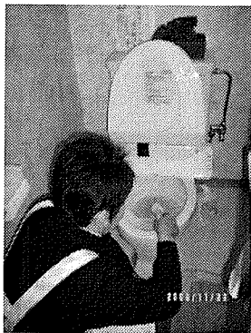
どお！見て ほんとに簡単なのよ～

これから年末にかけて大掃除をされる方も多いと思うので、ここで一つ、 トイレ掃除の裏ワザ をお教えしましょう！